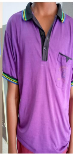
VAZI LA KAZI (SHAMBA DRESS )