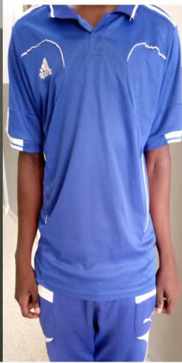
VAZI LA KUSHINDIA