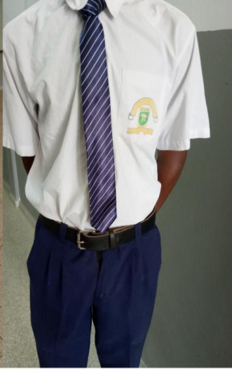
VAZI RASMI LA DARASANI