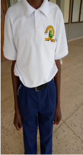
VAZI MBADALA LA DARASANI