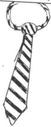
NECK TIE (TAI)