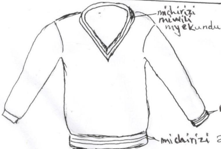
SWEATER (Grey) KIJIVU